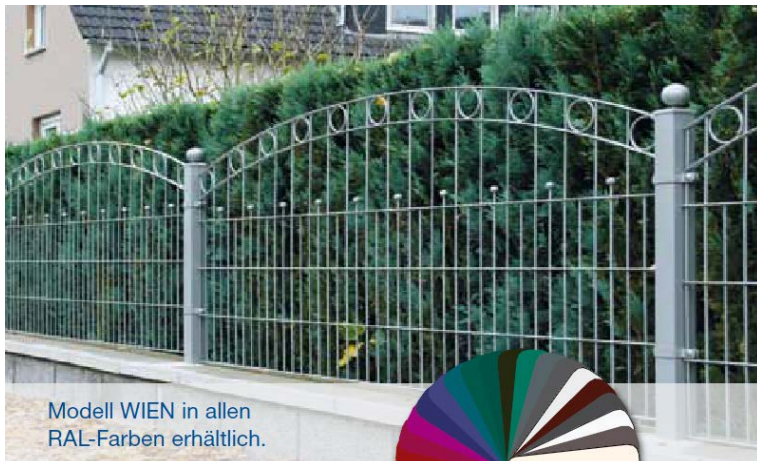
Modell WIEN in allen RAL-Farben erhältlich.