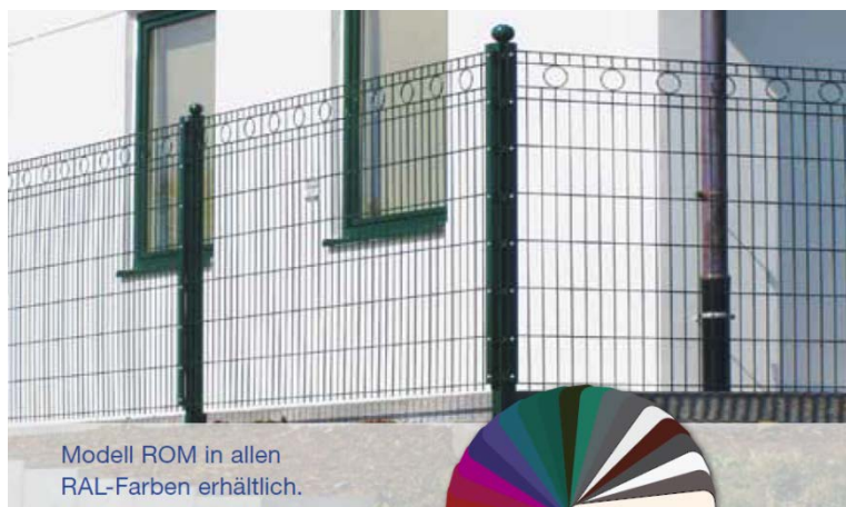
Modell ROM in allen RAL-Farben erhältlich.

Das Modell Rom ist ein zeitlos eleganter Schmuckzaun mit Kreis-Ornamenten im obersten Segment.