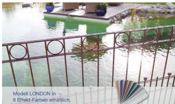
Modell LONDON in 8 Effekt-Farben erhältlich.

Ergänzend zu den Kreis-Ornamenten im oberen Segment befinden sich auf halber Höhe an jedem zweiten Stab aufgeschweißte Zierkugeln, die das Design vervollständigen. Die Serie wird standardmäßig mit einer hochwertigen Kunststoffpulverbeschichtung in Feinstruktur angeboten. Das Modell London zeichnet sich durch seine besondere und einzigartige Verarbeitung aus. Der Draht wird in sich gedreht und