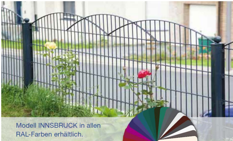
Modell INNSBRUCK in allen RAL-Farben erhältlich.