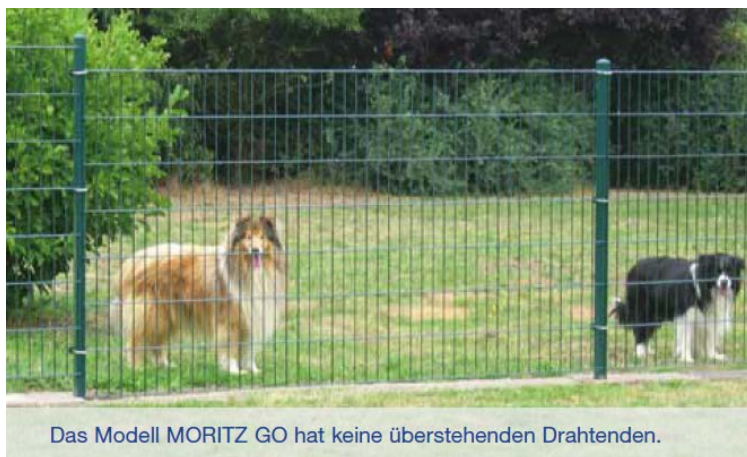
Das Modell MORITZ GO hat keine überstehenden Drahtenden.

Das Modell Moritz GO eignet sich ideal für den privaten oder gewerblichen Bereich. Im Unterschied zum Modell Moritz sind die Zaunfelder ohne überstehende Spitzen gefertigt und darüber hinaus im Tauchbad galvanisch verzinkt.