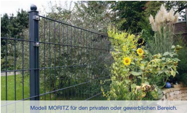
Modell MORITZ für den privaten oder gewerblichen Bereich.

Das Modell Moritz eignet sich ideal für den privaten oder gewerblichen Bereich. In erster Linie wird der Zaun zur individuellen Grundstückseinfriedung genutzt. Zu beachten ist, dass alle Zaunfelder einen 30 mm langen Überstand besitzen.