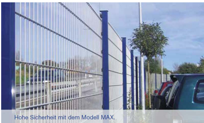
Hohe Sicherheit mit dem Modell MAX.

Das Modell Max findet seinen Einsatz bei Objekten mit höheren Sicherheitsanforderungen. Aufgrund der Drahtstärke von 2x8 mm wird dieses Modell häufig zur Objektsicherung in Industrie, Kommunen oder für private Bereiche mit hoher Beanspruchung eingesetzt. Zusätzlich ist auch ein Übersteigschutz in zahlreichen Varianten erhältlich. Zu beachten ist das alle Zaunfelder einen 30 mm langen Überstand besitzen.